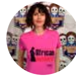
Nerea Barros Actriz