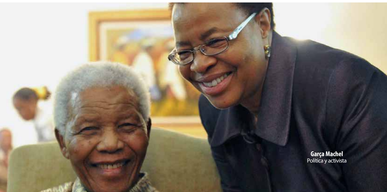
Garça Machel Política y activista