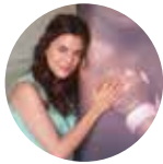
Adriana Ugarte Actriz