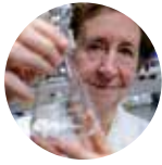
Margarita Salas Bioquímica